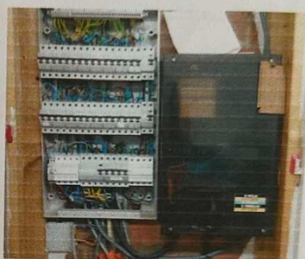
Visualisatie van de installatie